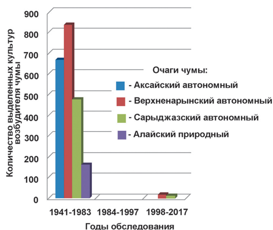
Рис. 1. Количество выделенных культур возбудителя чумы в высокогорных природных очагах Тянь-Шаня и Памиро-Алая в период с 1941 по 2017 год

На ранее оздоровленных территориях Верхнеарынского и Сарыджазского природных очагов вновь возобновились эпизоотии среди сурков, что связано с ростом и восстановлением на обработанных участках прежней численности специфических сурочьих блох. В результате эпизоотических проявлений в популяциях серых сурков в 2013 г. в Сарыджазском очаге (Аксуйский район Иссык-